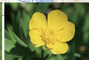
ミヤマキンポウゲ